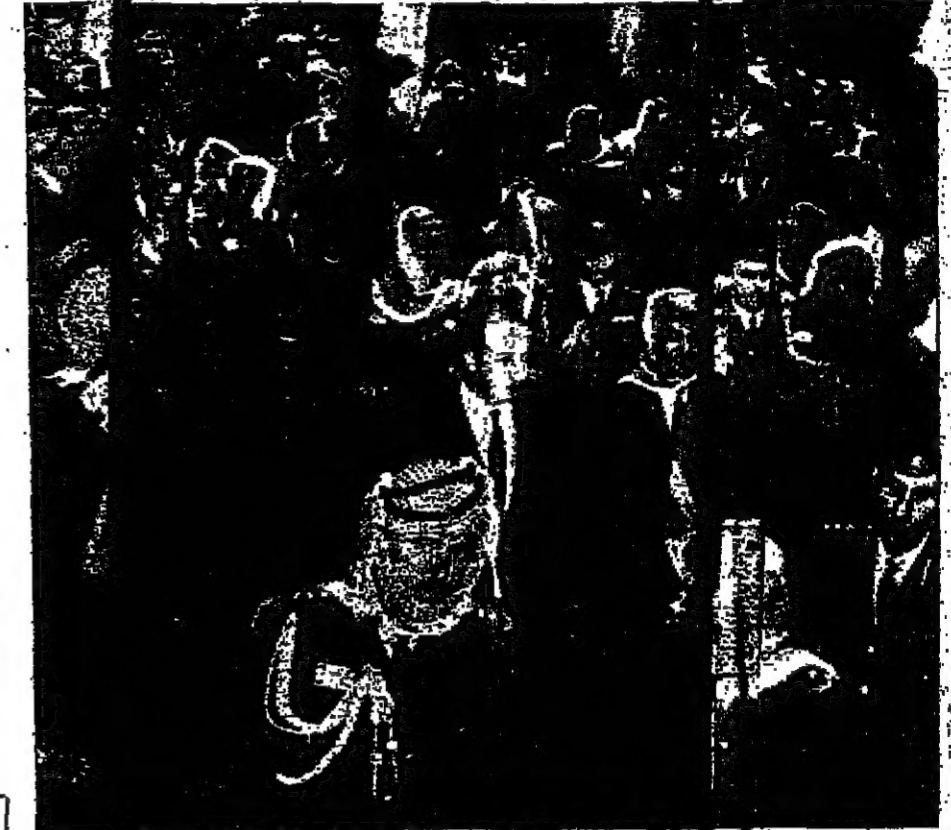
خلالة الملكة الأميرة المظمان لدى وصولها الى المسجد الحسيني في صلاة عيد الفطر المبارك

عمان - روى قادمون من القدس المحتلة ان عدد الصلح الذين امرو المسجد الأقصى صباح اول ايام عيد الفطر لم يتجاوز المئتين شخصاً . وان عددا كبيرا من نساء المدينة كن يتنحن بالاباس السوداء احتجاجا على الاحتلال الاسرائيلي للاكسنة . وقال شاهد عيان انه عندما اجلس لفيلة الشيخ جيسل الخليل خطيب المسجد الأقصى بقلعة حول اذان من رجال الشرطة الاسرائيلية مع احد القبط الاتقاء على خطيب المسجد واتزانه بالقول من غير الا ان الصلح على قلة معدوم استكروا هذا المسجد الوطني والانتهاك لحرمة المسجد فهاجموا رجال الشرطة وضرموا من الاتقاء على نصية الشيخ الخليل بطبع الامانة القوية من المسجد . وقال القادمون ان عددا كبيرا من القسوة كن يرتدين اللباس السوداء خارج المسجد ويهتفون استكروا هذا المسجد على حق حرية المسجد الأقصى وهم الاميد وان ضحوا من سكان المدينة المقدسة خرجوا في اول ايام العيد وهم يحملون الكليل واللافتات التي تحمل شعارات القرب والعروبة ووحدة القبلتين المقدسة وانجروا الى ابواب الشهداء الذين سخطوا ضامنا من القسوة .